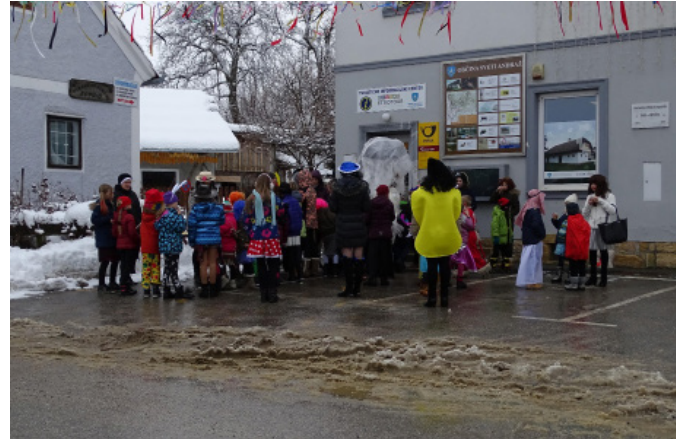
Otroci so se okrepčali