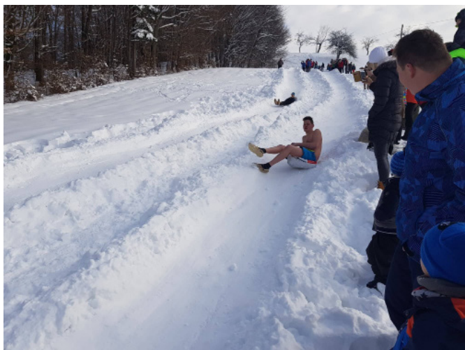
Pozimi tudi v kopalnih hlačah

2. paralelno žaklanje je potekalo v soboto, 24. 2. 2018, od 13. ure na meji vasi Drbetinci in Čagona - občine Sveti Andraž v Slovenskih goricah in občine Cerkvenjak. Tekmovanje je organiziralo Turistično društvo Vitomarci in Vaški odbor Drbetinci. V hitrostnem spustu s slamo polnjenimi plastičnimi žaklji je tekmovalo kar 38 tekmovalcev v moški konkurenci in 8 pogumnih v konkurenci nežnejšega spola. Še okrog 200 je bilo drugih obiskovalcev. Za prve tri smo priskrbeli medalje, za prvega in četrtega v vsaki konkurenci pa še praktično nagrado. Nagrado za izvirnost je prejel še tekmovalec iz okolice Ljubljane, ki se je spusta lotil samo v kopalnih hlačah.