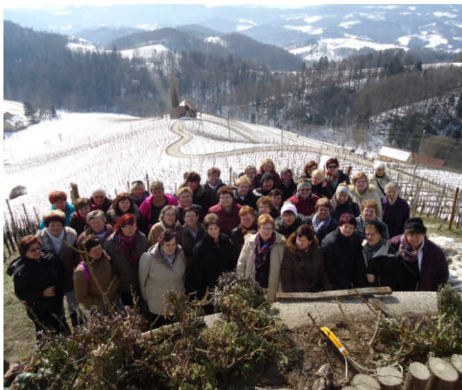
Gospodinje z znamenitim srcem med vinogradi