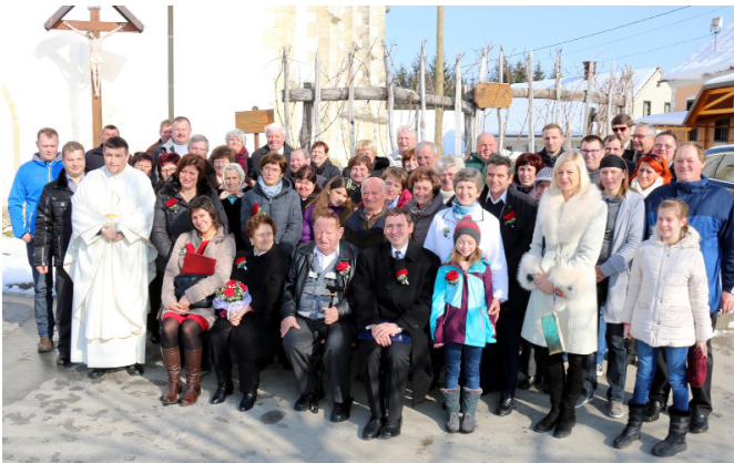
Zakonca s svati