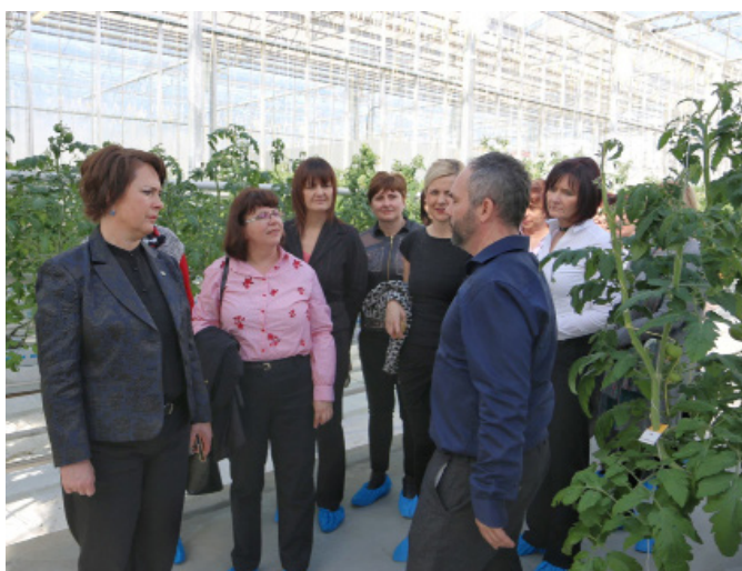
Z direktorjem podjetja Paradajz d.o.o

jim pri tem nudi podporo z vidika strokovnega usposabljanja, kadar se zanj pojavi potreba, pomaga organizacijsko, ne nazadnje pa deluje kot platforma, na kateri se takšna mreža županj lahko tudi dolgoročno ohranja in nadgrajuje«, je izpostavila.