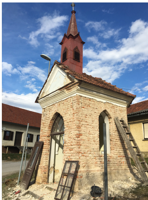
Obnova Antonekove kapelle

Projekt ESCAPE je mednarodni projekt v katerem sodelujemo skupaj s projektnimi partnerji iz Madžarske. V projektu razvijamo turistični produkt ESCAPE v šolstvo skozi čas. Šolstvo ima v občini dolgoletno tradicijo o kateri želimo podučiti obiskovalce in turiste. V sklopu projekta se je v prostorih POŠ Vitomarci uredila muzejsko interaktivna učilnica z razstavo šolskih pripomočkov, obnova Antonekove in Pavličeve kapelice ter krožna pot pod cerkvijo sv. Andreja.