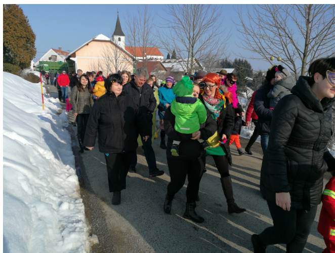
Povorke se udeleži vedno več navdušencev

V nedeljo, 11. februarja 2018, je od 9:30 naprej potekala že tretja večja povorka pri nas. Povorka je potekala od trga pred cerkvijo do Večnamenske dvorane Vitomarci.