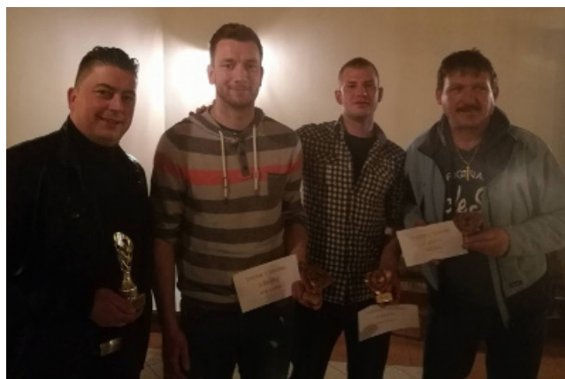
Najboljši igralci v šnopsu

Igralo se je na eno dobljeno igro, vsak pa je imel kar 5 življenj. To pomeni, da ko si petkrat izgubil, si končal s tekmovanjem.