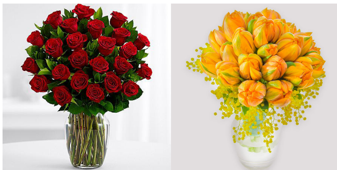
Šopek vrtnic in tulipanov

Če ste dobili tulipane, stebila najprej poševno prirežite in na dnu križno zarežite, tako se ne bodo prehitro odprli. Da pa ne bodo prehitro rasli, morate steblo takoj po nakupu prebosti z iglo pod cvetnim koškom. V vazo nikoli ne nalijte več kot 1,5 do 2 centimetra vode (v vazi še vedno namreč rastejo naprej), vendar pri tem pazite, da ne bodo stali na suhem. V knjigi o tulipanih piše, da ni najbolj pametno postaviti tulipane in narcise skupaj v eno vazo. Odrezane narcise namreč proizvajajo plin etilen in sluzast izloček na steblih, česar pa tulipani ne prenašajo.