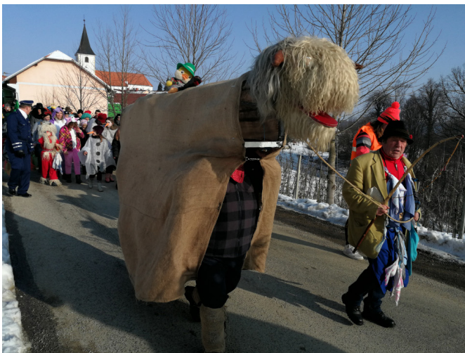
Znamenita rüsa z njenim pastirjem

Veseli nas, da se občani udeležite povorke. Zaradi primernega obiska imamo tako še večje veselje organizirati take povorke.