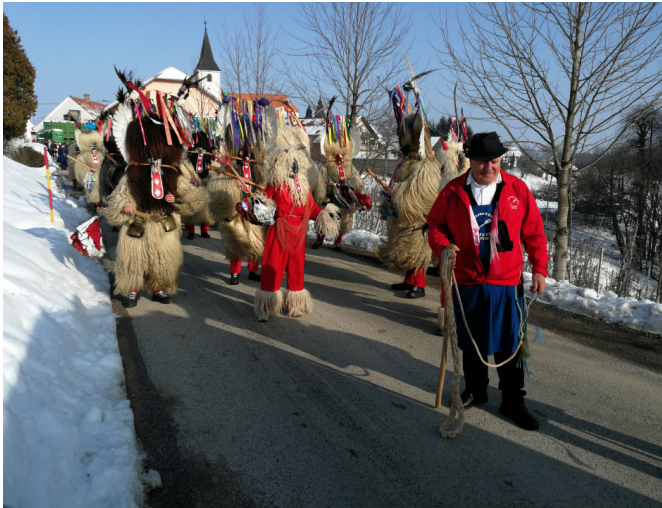
V ospredju pokač, za njim pa hudiček in kurenti

dvoje kurente. Kurentov iz sosednje Trnovske vasi je bilo deset, nekaj več pa kurentov iz Etnografskega društva Ježevka iz Mestnega vrha pri Ptuj. Zraven so pripeljali še pokača in rüso.