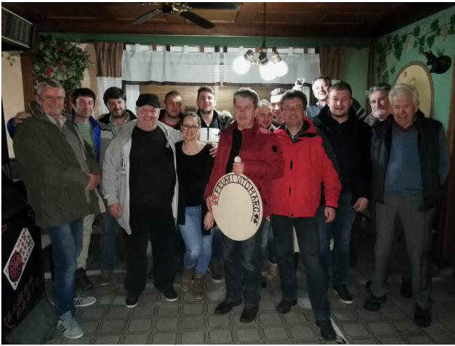
Udeleženci turnirja v šnopsu med zaselki Vitomarci

Nad vse pomembno je, da nas takšni in podobni projekti povezujejo in bogatijo družabno življenje v naselju oz. občini, so zadovoljni povedali krajanje Vitomarcev po uspešno izvedenih dogodkih.