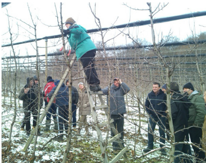
Praktično izobraževanje reza

Naši člani so s svojimi vzorci sodelovali na ocenjevanju vin v Vinici na Hrvaškem. Poslanih je bilo pet vzorcev vin, od tega so trije prejeli zlato priznanje.