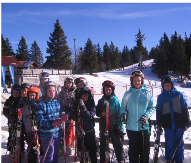
Učenci 5. b na zimski šoli