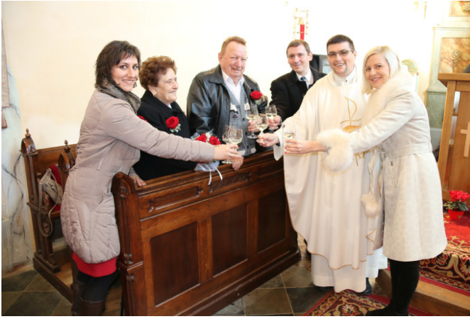
Zakoncema nazdravila župnik in županja