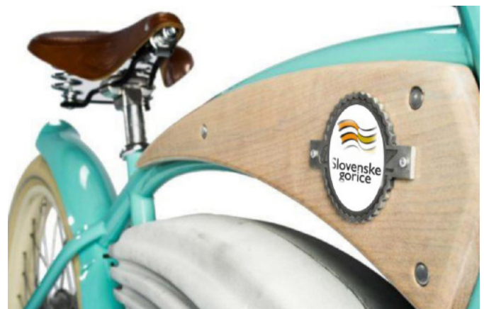
Kolesarske poti na območju Slovenskih goric

S projektom se celovito pristopa k urejanju kolesarske infrastrukture po razgibanem območju Slovenskih goric. Z njim se vzpostavlja možnost varnega prometa s kolesom od doma do delovnega mesta, šole, javnih in poslovnih subjektov v mestnih središčih Lenartu, Ptuj in Mariboru oziroma od doma do točk javnega potniškega prometa. Cilj projekta je, da se čim več dnevni migracij preusmeri iz avtomobila na kolo in javni potniški promet in se s tem prispeva k zmanjševanju onesnaževanja, večji stopnji telesne kondicije in zdravja, posledično pa k večji učinkovitosti in boljšemu počutju prebivalstva na območju. Razlog za pristop k investiciji je spodbujanje nizkoogljicnih strategij za vse vrste območij, zlasti za urbana območja, vključno s spodbujanjem trajnostne multimodalne urbane mobilnosti. Z ustrezno urejeno infrastrukturo za kolesarje in pešce bi se izboljšali pogoji za varno rekreacijo prebivalcev. Posledično bi se povečala dnevna aktivnost ter zdravje prebivalcev regije.