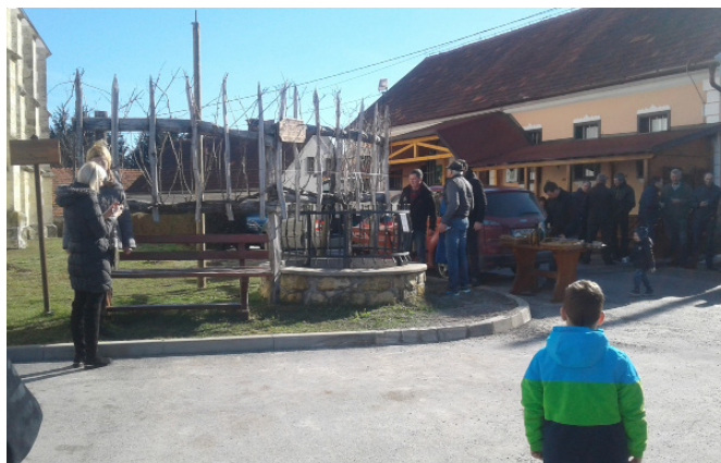
Rez potomke stare trte

V soboto in nedeljo, 9. in 10. junija bo izvedena strokovna ekskurzija društva v Šibenik. Vabljeni k udeležbi.