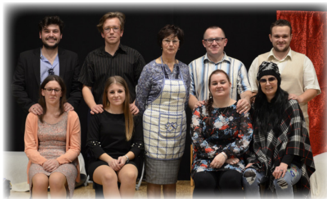
Letošnja zasedba ODGS