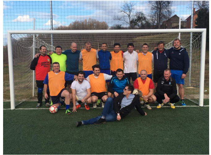
Prijateljska fotografija po tekmi