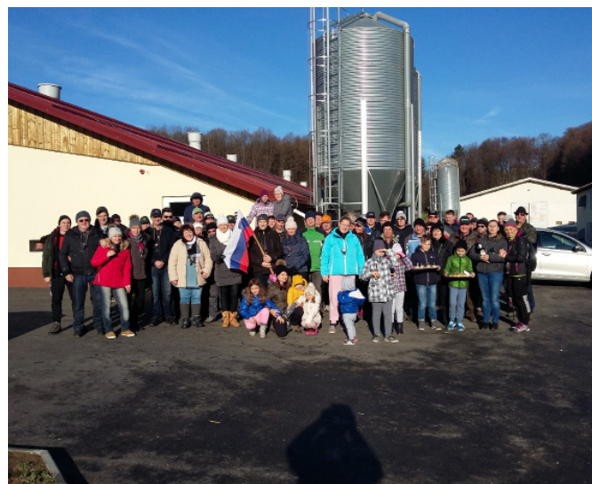
Na startu petega pohoda

Zahvala gre vsem družinam, ki so pohodnike sprejele v svoj dom in jim ponudile okrepčilo, prav tako pa vsem vam, ki se udeležujete naših pohodov in tako pripomorete k prijetnemu druženju in pozitivnemu vzdušju.